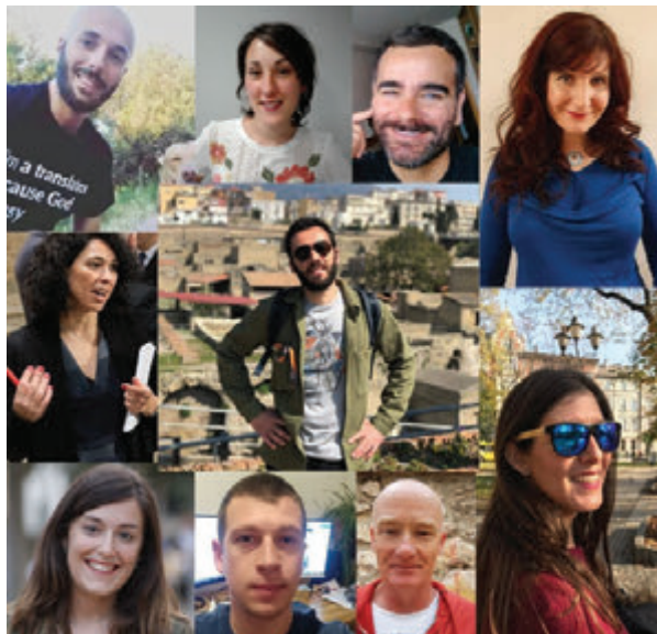
Algunos miembros de nuestro equipo boutique de freelancers de las combinaciones de idiomas más demandadas.